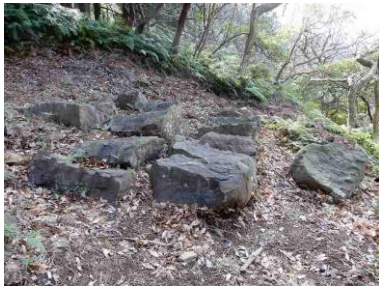
築城石置場（石丁場）