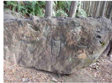
毛利家（矢筈紋）刻印石

みどころ：平成28年3月1日に伊東市、熱海市、小田原市に所在する3つの石丁場が「江戸城石垣石丁場跡」として史跡に指定されました。その史跡の1つである伊東市宇佐美のナコウ山の石丁場を体験し、その歴史を紹介いたします。 (高低差 200m、一般向き)