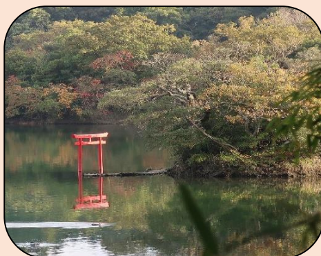
光栄寺住職の祈りを込めて