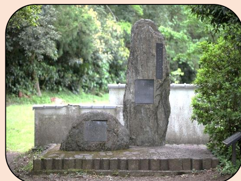
与謝野寛・晶子の歌碑