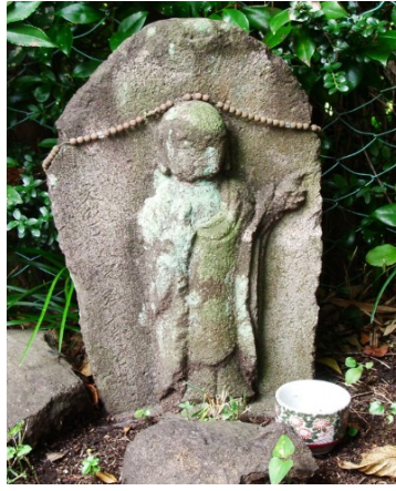
逆川神社の指差し地藏