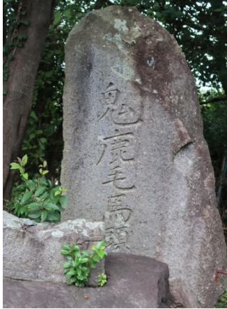
珍しい鬼鹿毛馬頭観音